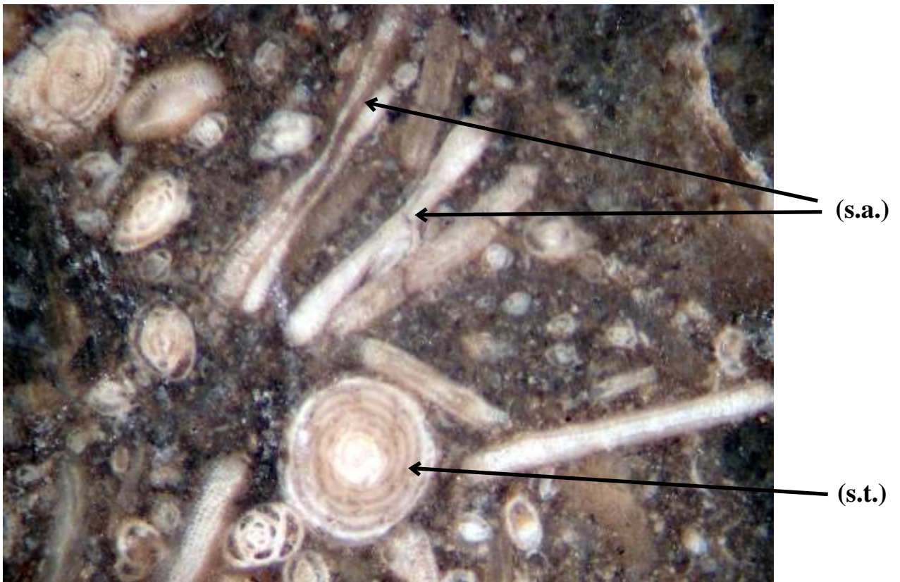
23_3 : Conglomérat à matrice bioclastique (photo de détail x 0.63) montrant une section transversale (s.t.) et une section axiale (s.a.) de Foraminifères Orbitoline.